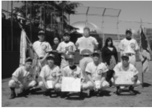
優勝のビッグビーツチーム

第56回岐阜ファッション産業親善野球大会(社岐阜ファッション産業連合会・岐阜繊維健康保険組合・岐阜繊維卸売業厚生年金基金主催・岐阜市・岐阜新聞・岐阜放送・岐阜市軟式野球連盟後援)は春たけなわの4月19日、20日の両日、岐阜市の市民球場で行なわれ、決勝は昨年と同じビッグビーツとサンラリーマリナースと対戦。