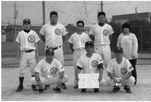
準優勝 ビッグビーツ