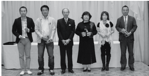
ベストコーディネーター入賞者の方々