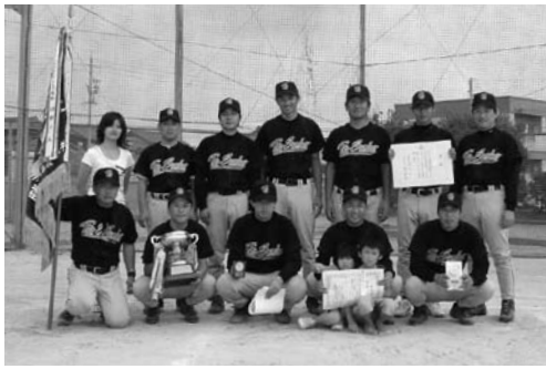
優勝 FYP サンバー