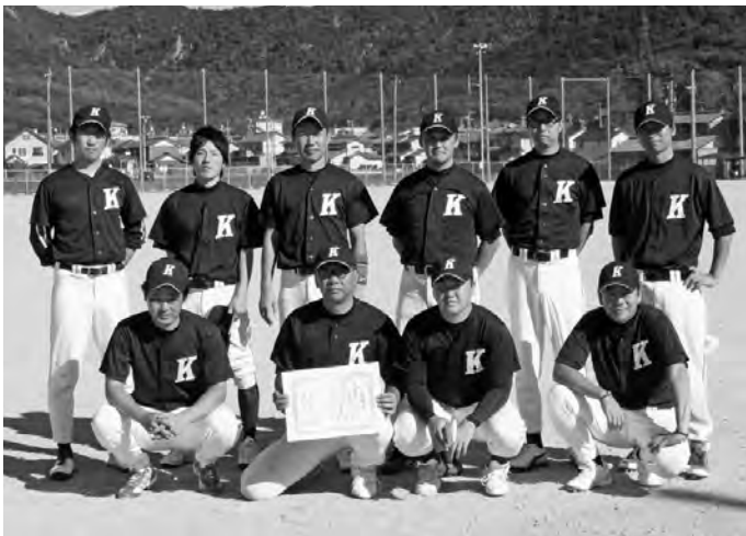
準優勝 清川(株)YK60チーム