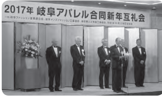
2017岐阜アパレル合同新年互礼会 平成29年1月6日(金)岐阜グランドホテル

(一社)岐阜ファッション産業連合会、岐阜メンズファッション工業組合、岐阜婦人子供服工業組合、駅前(東部・中部・西部)三地区協議会の岐阜アパレル4団体合同の新年互礼会を1月6日(金)、岐阜グランドホテルにて開催いたしました。当日は、行政、金融機関や仕入先関係者、及び主催団体の会員企業など合わせて約300人が出席、新年の飛躍を誓いました。