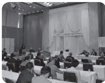
第44回会員総会 平成29年5月25日(木) グランヴェール岐山 17:00~

その中でも、今年度の事業計画では、ア・ミューズ岐阜、ギフト開催による販路拡大と販売促進を図ることなどを決め、議事は全て終了いたしました。 会員総会終了後、別室に移動して約100名が参加して懇親会が開催されました。